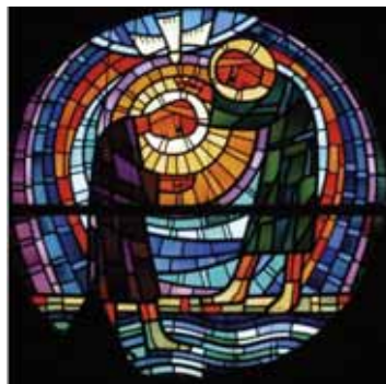
Fenster an der Westseite der evangelischen Johanneskirche in Bielefeld-Quelle, nach einem Entwurf von Ernst Hansen, 1956.

Das Wasser spielt in allen fünf Weltreligionen eine zentrale Rolle. So begegnet es uns im Islam, Hinduismus und Judentum bei rituellen Reinigungen, im Buddhismus und Hinduismus als bedeutendes Element und personifizierte Kraft der Reinigung von Körper und Geist.