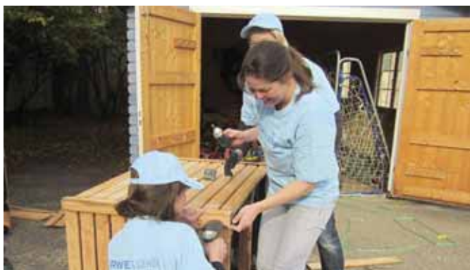
Mit viel Freude und Elan bauten die Helferinnen und Helfer ein neues Gartenhaus für die „Kleinen Freunde“ in Hoven. RWE Deutschland übernahm hierfür die Kosten.