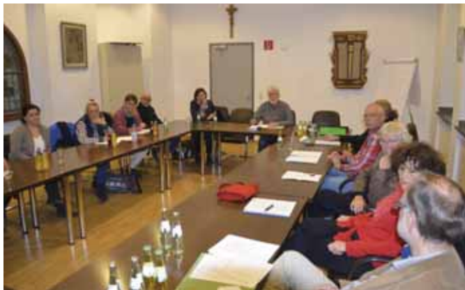
Runder Tisch Flüchtlingsarbeit.